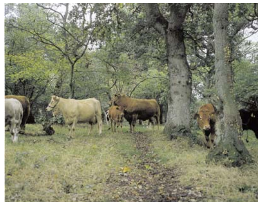
Langå Egeskov, Midtjylland.