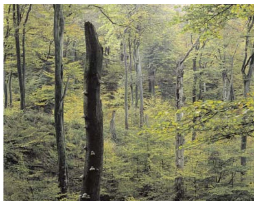
Velling Skov, Midtjylland.