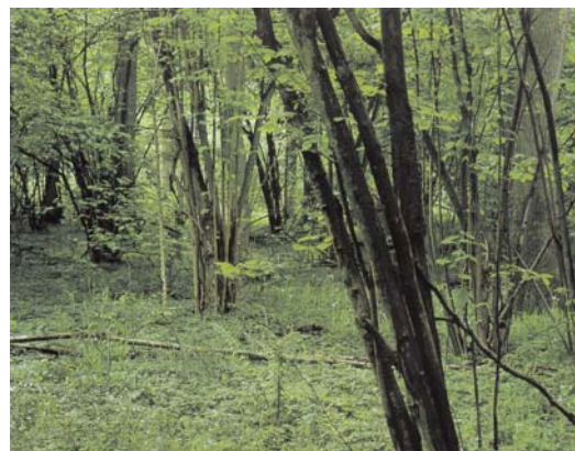
Vesterskov, Østjylland.